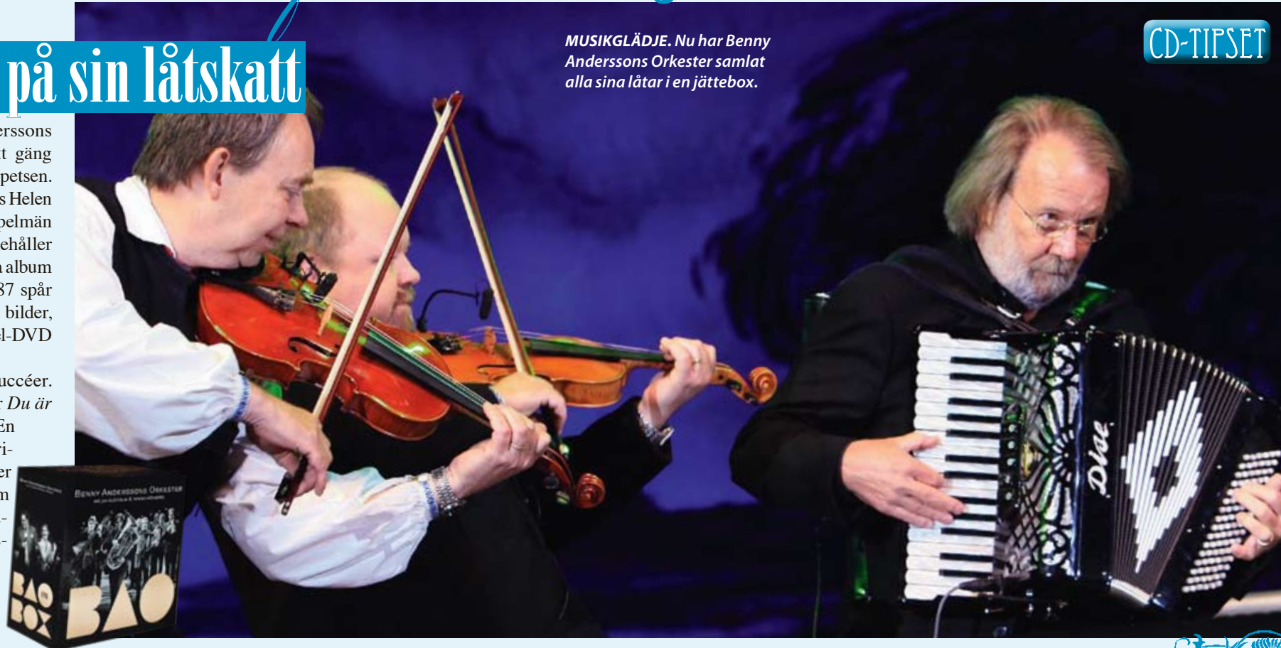
MUSIKGLÄDJE. Nu har Benny Anderssons Orkester samlat alla sina låtar i en jättebox.

Titel: BAO in box. Pris: 399 kronor. Köpställe: www.cdon.se .