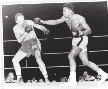
Muhammad Ali har faktiskt boxats i Sundsvall. Här i en match mot britten Henry Cooper 1966.