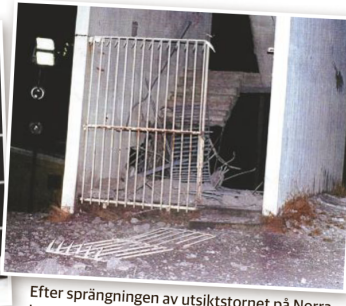
Efter sprängningen av utsiktstornet på Norra berget i februari 1996.