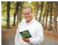
Jonas Jonassons roman blir musikal.