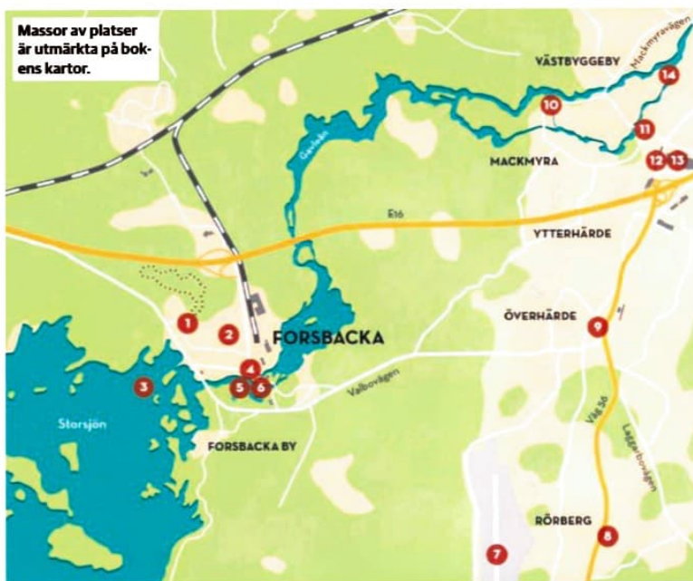
Massor av platser är utmärkt på bokens kartor.

Är journalist och lokalhistoriker. Plockar firpar i Gamla Gefle.