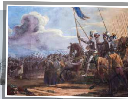
Slaget vid Brännkyrka. På den nationalromantiska målningen av Johan Gustaf Sandeberg håller Gustav Vasa i banéret. Brännkyrka socken var tidigare ett område som sträckte sig över hela söderort och in i Nacka.