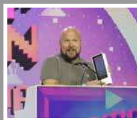
Spelgurun Markus "Notch" Persson.

Markus "Notch" Persson inspirerades av utsikten från